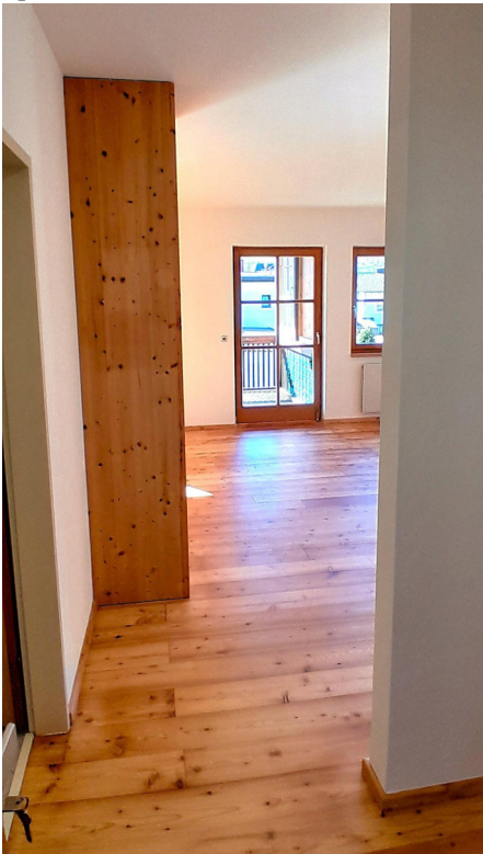
Eine andere Wohnung, die wir saniert haben.

Ich hoffe, unsere Handlung ist auch im Sinne unserer Spender und Spenderinnen.